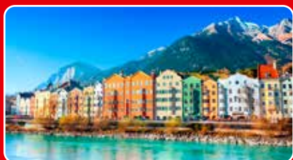
Tyrolen, sid 3