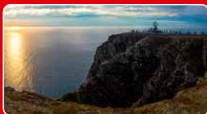
Nordkap, sid 25