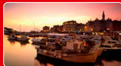
3 medelhavsländer, sid 12