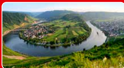
Flodkryssning, sid 4