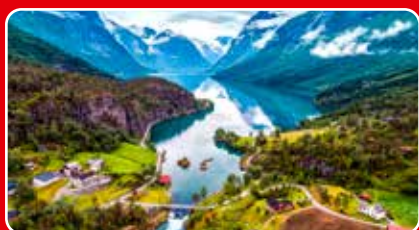
Stavanger - Bergen, sid 22